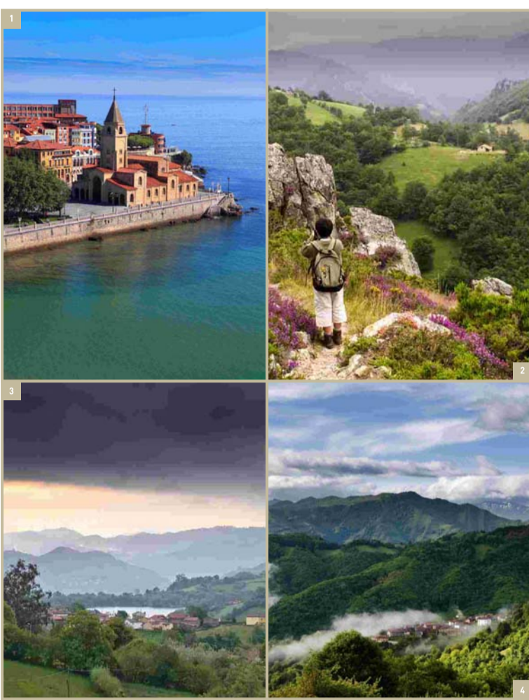
1. Cimadevilla, Gijón 2. Panoramabild, Aller 3. Ansicht von Morcín 4. Villar de Gallegos, Mieres. Foto: Carlos Salvo Luengo 1-2-3: Überlassen von Sociedad Pública de Gestión y Promoción Turística y Cultural del Principado de Asturias, SAU