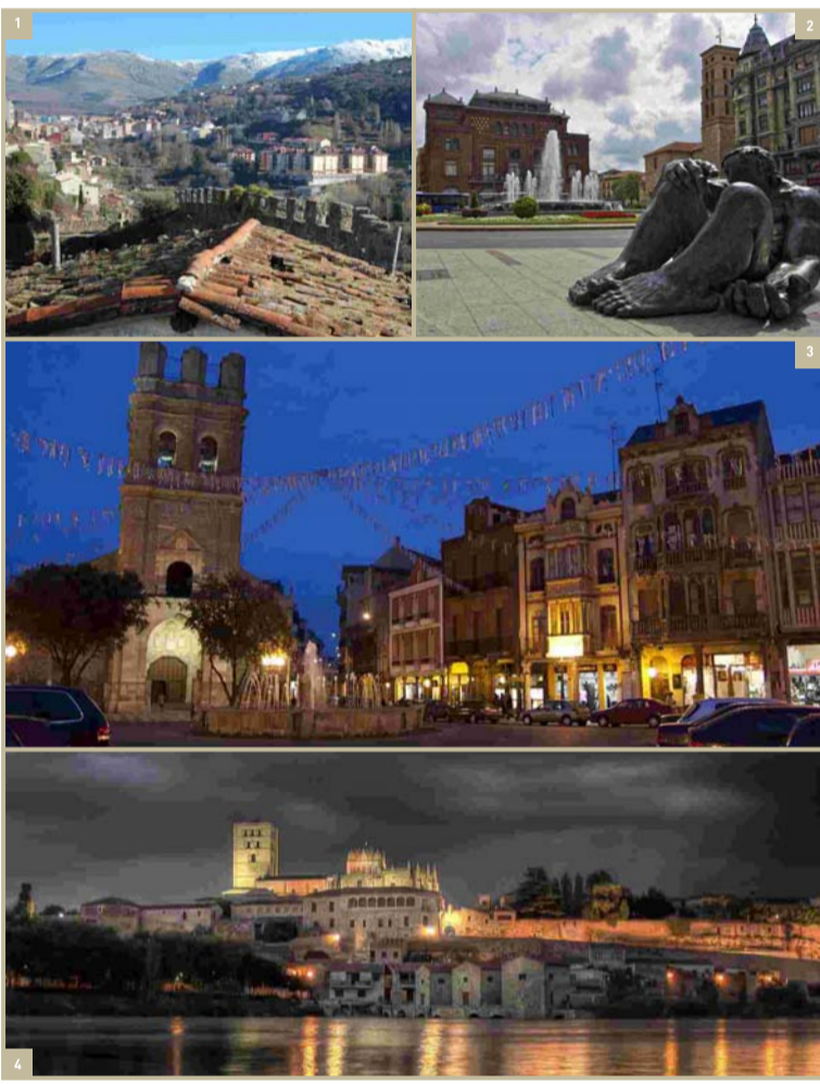
1. Panoramabild von Béjar 2. Plaza Santo Domingo, León 3. Plaza Mayor, La Bañeza 4. Panoramabild, Zamora